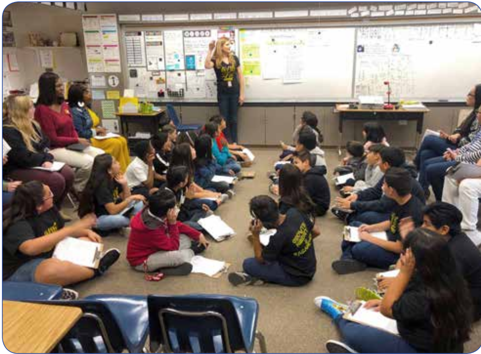
Students from Jefferson Elementary School use academic language to support their opinions as they engage in Philosophical Chairs. Los estudiantes de la escuela Primaria Jefferson utilizan el lenguaje académico para apoyar sus opiniones cuando participan en Cátedras Filosóficas.