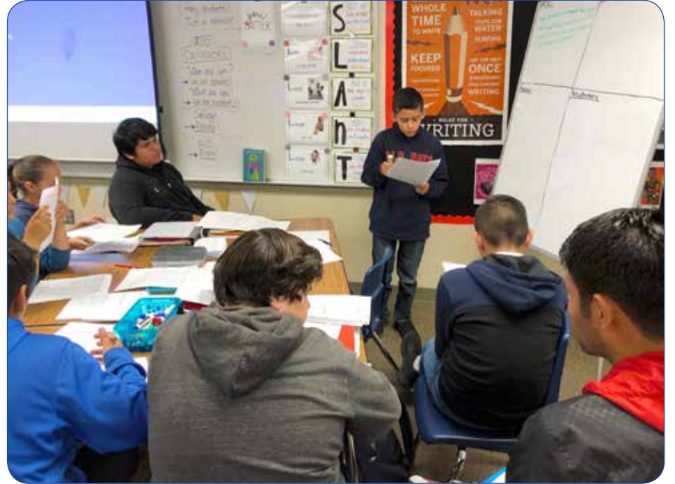
Hollydale 7th-grade AVID Excel Elective students participate in inquiry during Scholar Groups. Los estudiantes de séptimo grado de Hollydale participan en la electiva de AVID Excel en la investigación durante grupos académicos.

Paramount Unified School District promotes AVID’s mission to close the achievement gap by preparing all students for college and career readiness in a global society. AVID stands for Advancement Via Individual Determination. AVID data shows that 93% of AVID seniors complete requirements for four-year college entrance with a 90% acceptance rate. The AVID philosophy at elementary and secondary levels supports the four focus areas in Paramount USD’s Strategic Plan: