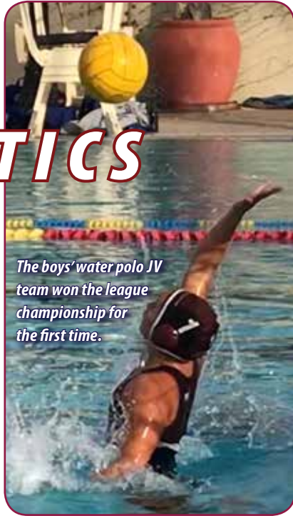
The boys' water polo JV team won the league championship for the first time.

As the chill in the air reminds us, winter has arrived in Paramount—at least the winter sports season has. Before jumping into the winter season preview, we want to take a look back at the fall sports teams and athletes. For the first time in our school's sports history, all of our fall sports programs made it to post-season play in the CIF playoffs. Pirate fall athletics have set the standards high for all upcoming sports.